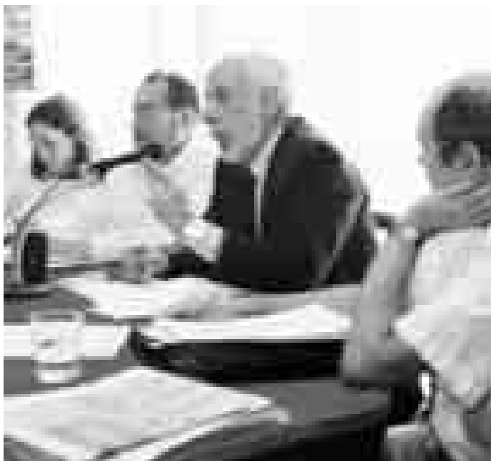
El debat de mijans públics al Congrés de la CSP

cràtica, i malgrat el tacticisme de molts partits, defensors o contraris a un model no governamental de RTV pública segons la conjuntura, l'oportunitat política o si controla totalment o parcialment un mitjà, creiem que és irreversible l'avenç cap a un model d'independència, neutralitat i pluralisme, en sintonia amb l'entorn europeu i sobretot amb la societat, que mereix uns mitjans realment públics, que responguin a l'interès general en el camp de la informació, la formació i l'entreteniment. La Confederació de Sindicats de Periodistes (CSP) en fa, des del primer moment, un dels seus cavalls de batalla.