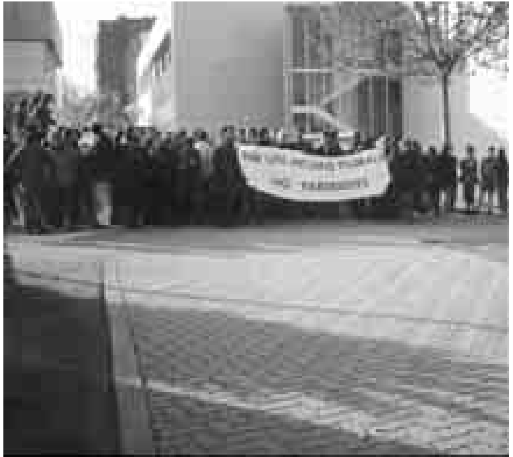
Treballadors de TV3 es manifesten a l'interior de les instal·lacions de Sant Joan Despí

Creiem que aquest plantejament respon a l'esperit del debat sobre l'audio-visual celebrat fa un any i mig i lamentàriem que el Parlament de Catalunya defraudés les expectatives socials i professionals creades aleshores i no fos l'exemple per a tot Espanya d'uns mitjans públics al servei de tota la societat.