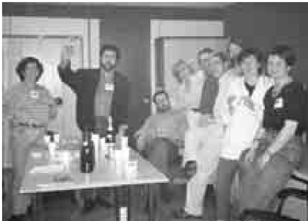
Inauguració de la nova seu de la secció sindical de l'SPC a TVE Sant Cugat

H o dèiem en un article antic i en alguna circular informativa: reforçar el sindicat, fer-lo viure a les empreses, plasmar en la pràctica per què és útil l'SPC i garantir la presa democràtica de decisions, aplicant un sindicalisme participatiu i no burocràtic, exigeix que s'organitzin seccions sindicals i, a on n'hi ha, que es revitalitzi i concreti la seva actuació. L'objectiu de les seccions sindicals és el de tractar els problemes laborals i professionals al lloc de treball des d'una òptica diferent a la dels comitès d'empresa, on els membres del sindicat s'ocupen sobretot del dia a dia i ho fan amb representants d'altres col·lectius de la comunicació i d'altres sindicats (si n'hi ha). Així com l'Estatut dels Treballadors regula el que és la representació unitària dels treballadors (comitès d'empresa i delegats de personal), la Llei Orgànica de Llibertat Sindicals (LOLS) que garanteix el que el franquisme prohibia -la lliure afiliació sindical- permet organitzar els afiliats i escollir la figura del delegat o delegada sindical, amb els mateixos drets i garanties dels membres dels comitès d'empresa. Aquests treballadors poden assistir a les reunions dels comitès d'empresa encara que no tenen vot.